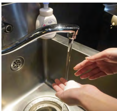
従業員は定期的に 手洗いを実施しています。