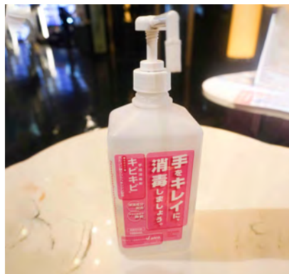
店内に 消毒用アルコール 設置してます。