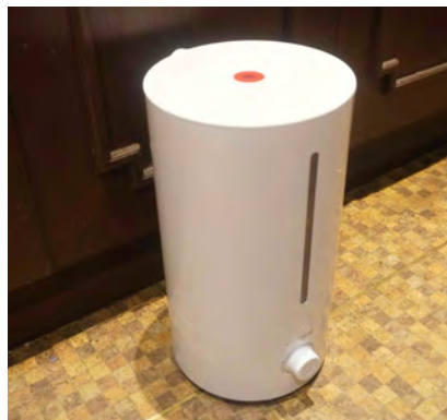
強力除菌 次亜塩素酸水で 空間除菌。

OXOでは、 新型コロナウイルスによる感染症対策として 終息までの間、 各種の予防衛生管理を強化徹底 しております。